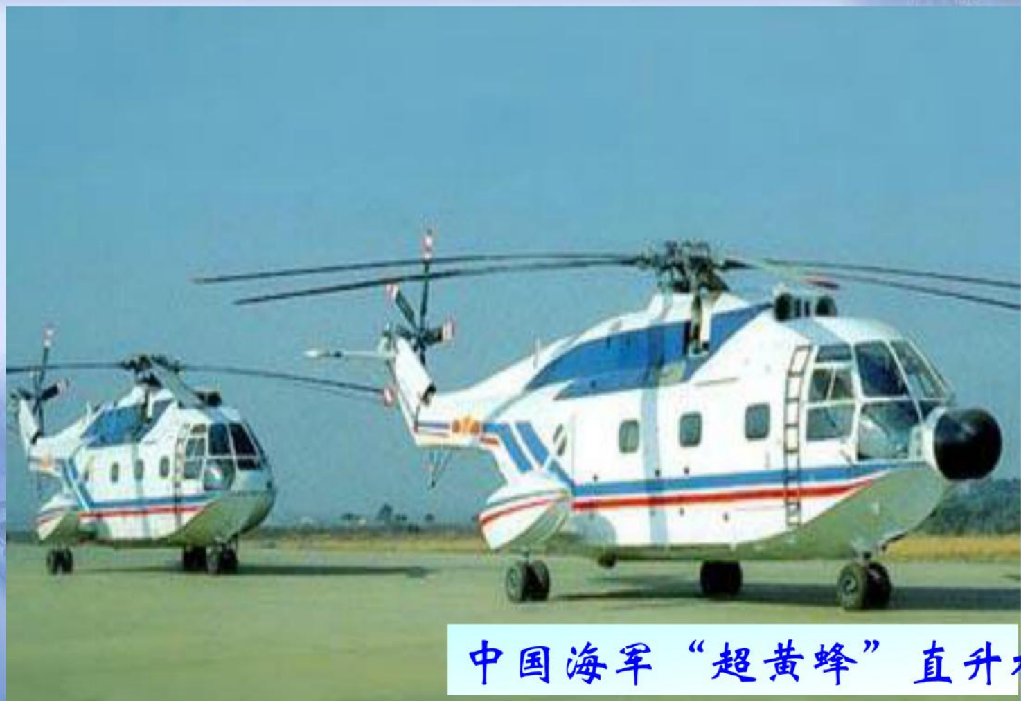
中国海军“超黄蜂”直升机