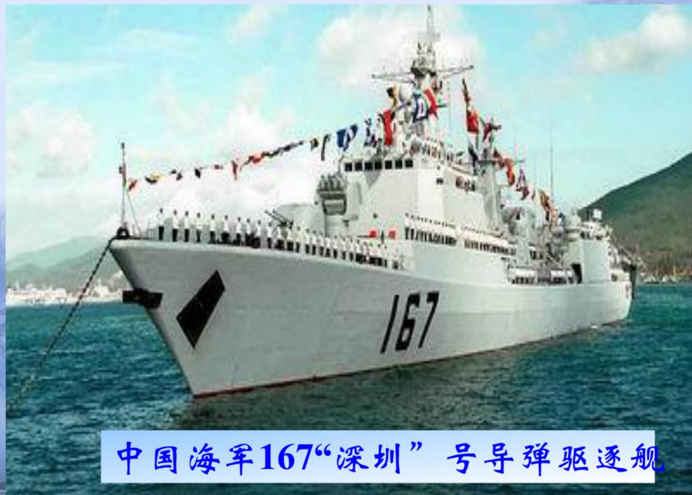
中国海军167“深圳”号导弹驱逐舰