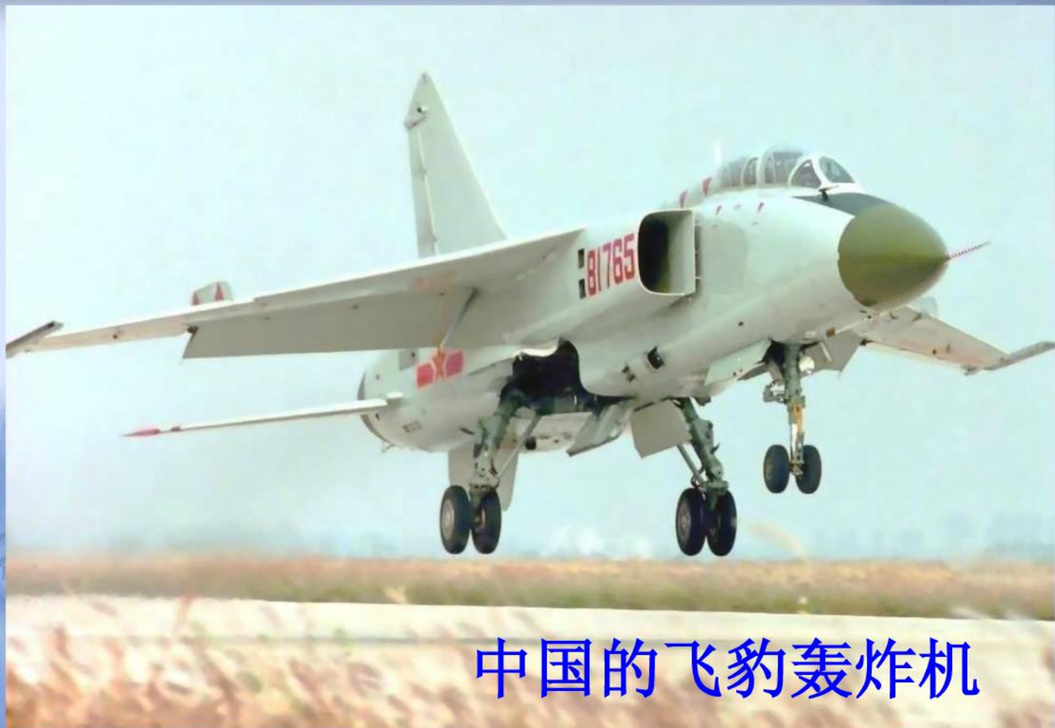
中国的飞豹轰炸机