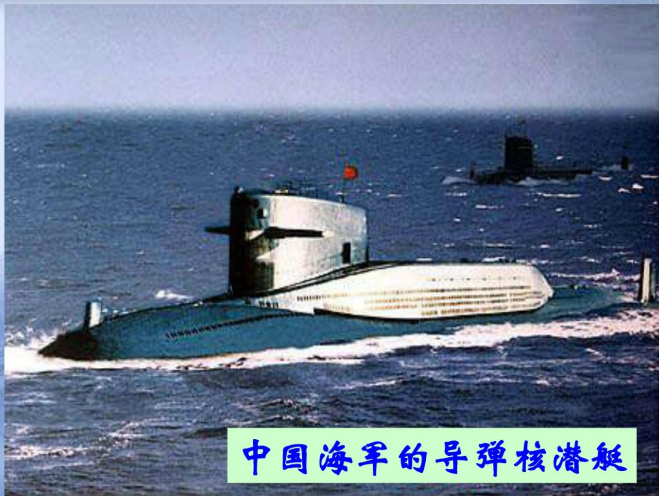
中国海军的导弹核潜艇