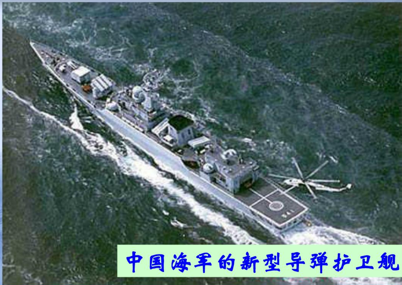
中国海军的新型导弹护卫舰